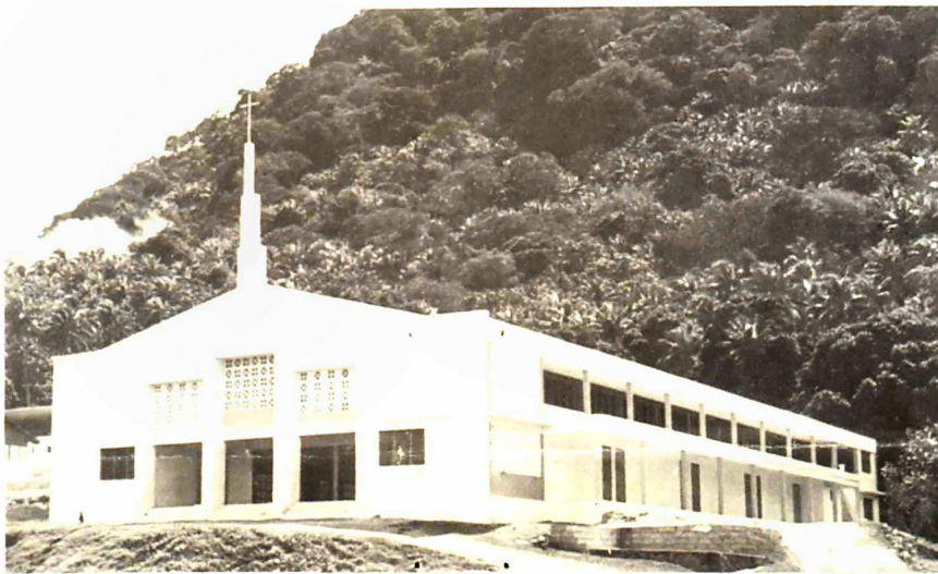
The church at Melsisi will be featured in our FDC design L'église de Melsisi sera le sujet de notre enveloppe officielle

Emission de Noël 1973 19 Novembre Christmas 1973 Issue 19th November